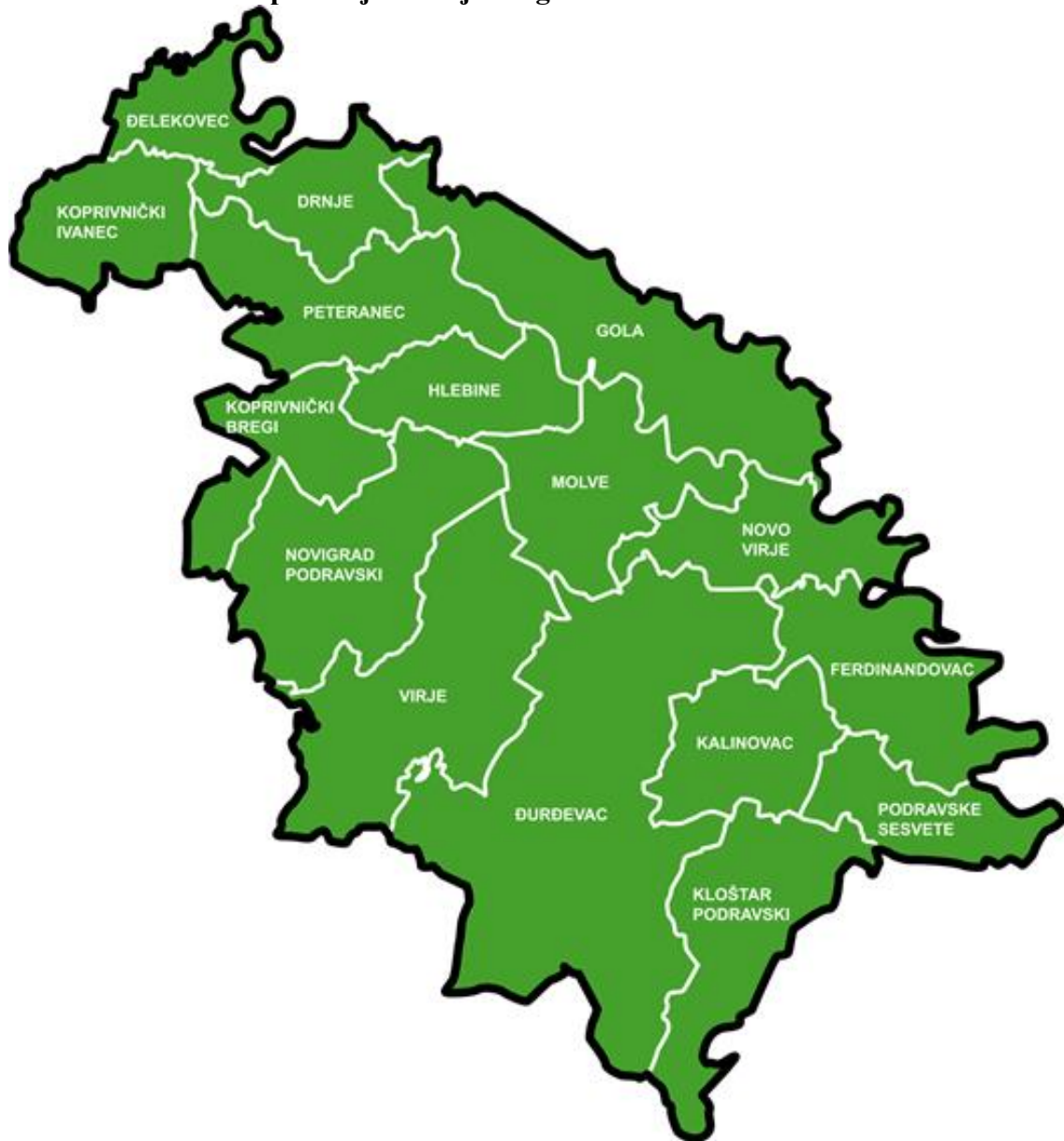
Slika 1: Karta LAG područja s vidljivim granicama JLS-ova u LAG-u

infrastrukturu. Područje razvijene poljoprivrede. Sve veći značaj ima vinogradarstvo, pčelarstvo, turizam i gastro ponuda.