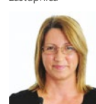
Ivana Maletić Europski parlament, zastupnica

„Hrvatska, temeljem dugogodišnje tradicije i stručnosti, može uvelike pridonijeti održivom razvoju na šumi baziranih industrija kao pokretača zapošljavanja i gospodarskog rasta.