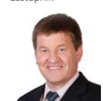
Franc Bogovič Europski parlament, zastupnik

„Uzgoj kultura kratkih rotacija za industrijsku i energetska upotrebu, kako bi se smanjila potražnja za drvom iz šume, pridonosi održavanju izvornih šuma.