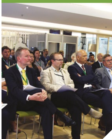
Marijana Petir Europski parlament, zastupnica