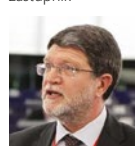
Tonino Picula Europski parlament, zastupnik

„Činjenica je da EU nema zajedničku šumarsku politiku, međutim financira se cijeli niz programa u kojima države mogu poboljšati svoje stanje u šumama.